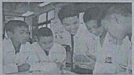
บ้านคันทนา หน้า ๕๑

ส่งเสริมธุรกิจในระดับมัธยมศึกษา เพื่อการพัฒนาเศรษฐกิจของประเทศ