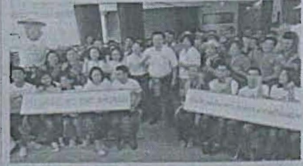
บ้านคันทนา หน้า ๕๒

วิไลสง ขู เดอะ เวสต์ ค้นแบบหมู่บ้านท่องเที่ยวชุมชน