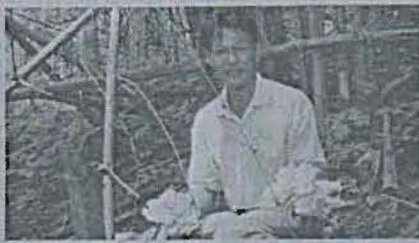
บ้านคันทนา หน้า ๕๐

ขยายการจัดจิงป่าชุมชน เพื่อการอนุรักษ์นิเวศป่าที่ยั่งยืน